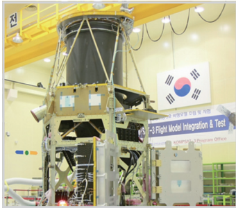
발명자 | 김용복 선임연구원 (위성제어팀)